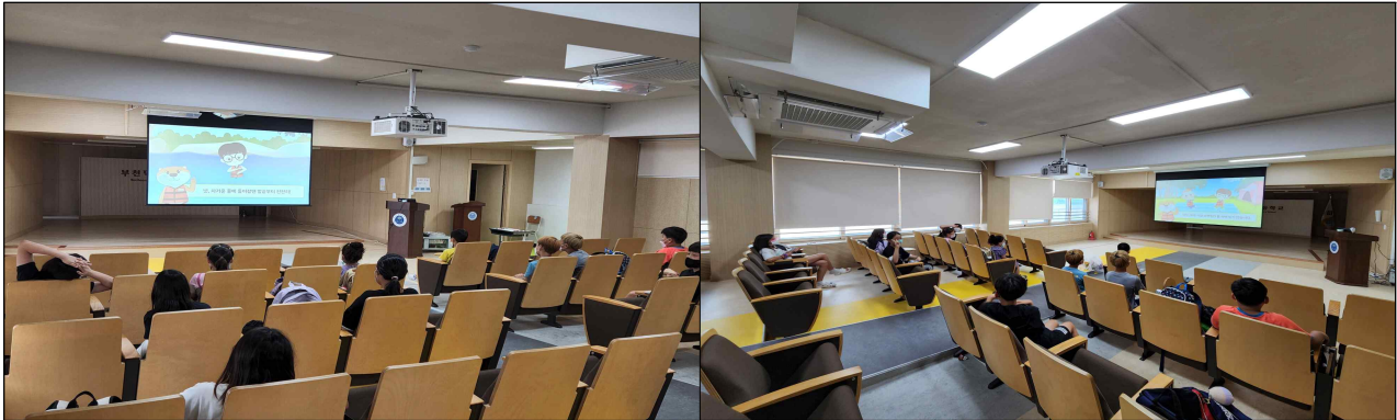
물놀이 안전 및 여름철 감염예방 교육